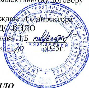
График работы работников МБУ ДО КЦДО